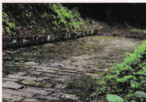
3. ábra. Dák út Sarmizegetusa Regiában (íratlan történelmi forrás)