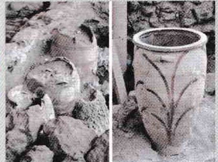
7. ábra. Agyagedények