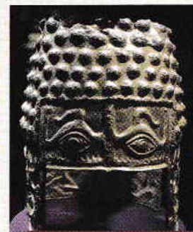
4. ábra. Dák sisak Coțofenești-ből (íratlan történelmi forrás)