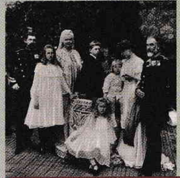
1. ábra. A román királyi család Sinaian (1907)