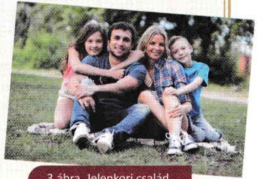
3.ábra. Jelenkori család

Az emberi társadalom családokból tevődik össze (3.ábra). Általában egy családon a szülő és a gyerekek közötti kapcsolatokat értjük, de az összes egymással rokoni kapcsolatban lévő személyeket is (nagyszülők, unokák, unokatestvérek, nagybácsik, nagynénik). A családtagok közötti kapcsolatok lehetnek biológiaiak vagy kötöttek (házasság és örökbe fogadás ). A legrégebbi időktől fogva a család volt az a lehetőség, ami által az emberek biztosítani akarták az emberiség fennmaradását azáltal, hogy óvták fiatal utódaikat. A család által a gyerekek megkapják azt a gondoskodást és törődést amely szükséges egy normális élethez és oktatáshoz.