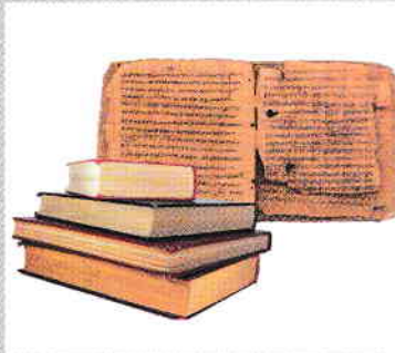
6. ábra. Könyvek és kéziratok