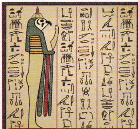
2. ábra. Papirusz hieroglifákkal (írott történelmi forrás)

A földrajztól és a biológiától eltérően, például, a történelemnek nincs közvetlen hozzáférése a történelmi tényekhez. Nem láthatjuk a saját szemünkkel, hogy mi történt a vászlói (Vaslui) csatában (1475. január 10) vagy nem tudunk részt venni Ferdinánd király (1914-1927) és tanácsosai beszélgetésein. Azonban tudjuk az írott (felíratok, agyagtáblák, papirusz tekercsek, krónikák, dokumentumok, újságok, könyvek, stb.) és íratlan (romok, fegyverek, kincsek, edények, csontok, stb.) történelmi forrásokból kiindulva. Tehát a történész az a szakember, akinek az a feladata, hogy megismerje és megértse a történelmet, hasonló egy detektívhez, aki utalásokat keres az igazság megismeréséhez. Az íratlan (3, 4. ábrák) és írott (2. ábra) források által szolgáltatott információk hasonlóak egy puzzle darabjaihoz, amelyek alapján a történész a múlt eseményeit újra összerakja.