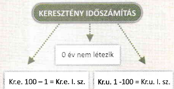
9. ábra. A keresztény időszámítás felosztása

A korszak a leghosszabb ember által ismert időszak. Ez több korra van felosztva és egy fontos eseménnyel kezdődik. Sok nép, többek közt mi is, az időt két nagy időszakra osztja fel Krisztus születésétől kiindulva (9. ábra). Ezáltal, létezik a Krisztus születése előtti időszak, amikor az éveket visszafelé számoljuk, illetve a Krisztus születése utáni időszak (keresztény időszámítás), amikor az éveket növekvő sorrendbe számoljuk.