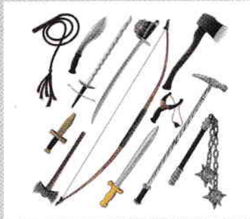
5. ábra. Fegyverek és eszközök

II. Ismerd fel az alábbi képeken ábrázolt történelmi forrásokat: